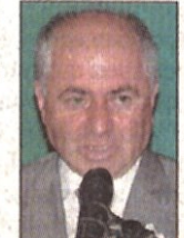
Av. Selami Öztürk (Kadıköy Bld. Başkanı)

Bu güne kadar "Kadıköy'de yaşamak bayındır" bizim sloganımız oldu. Bu dönemlerin tümünde dünyadaki gelişmelerin yakını takipçisi olduk. Kadıköylü olmak da bunu gerektiriyordu. Bunu da Kadıköylülerle birlikte yaptık. Herkes için sağlık ilkesi kapsamında Dünya Sağlık Örgütü'nün Avrupa Bölge Bürosu "Sağlıklı Şehirler Projesi"ni başlattı. Bu gelişmeler doğrultusunda kentin çevre ve sağlık sorunlarını birlikte tartışmak ve çözüm bulmak, sağlıklı bir kente ulaşma hedefimiz var. Bu nedenle artık yeni sloganımızı "Sağlıklı Kent Kadıköy" olarak belirledik. Bunu seçim döneminde sık sık belirttik. Sağlıklı Kent Kadıköy'ün "Kent Konseyi"ne merhaba diyorum.