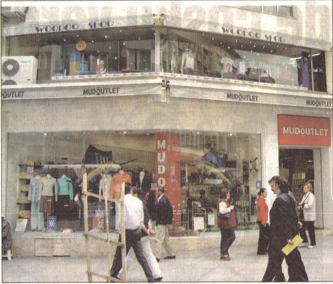
Cadde'de ünlü markaların ucuzluk mağazaları açılıyor...