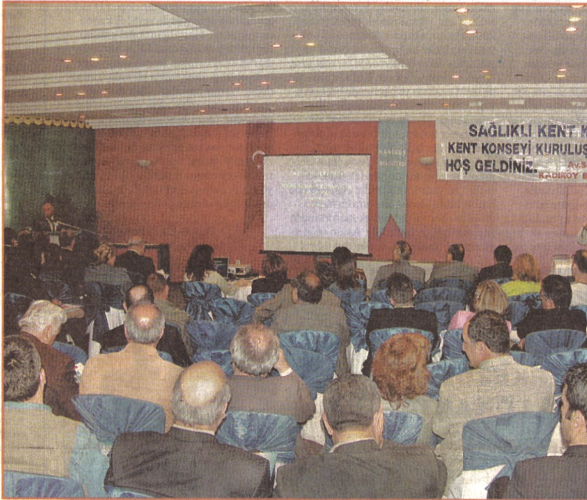
Bir halk meclisi olarak görev yapacak olan Kent Konseyi, ilk toplantısıyla çalışmaya başladı..