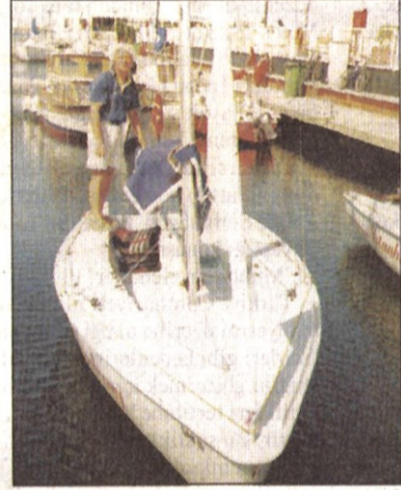
Kadıköy, yelkenin merkezi...